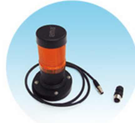
贯通式前门和后门模组